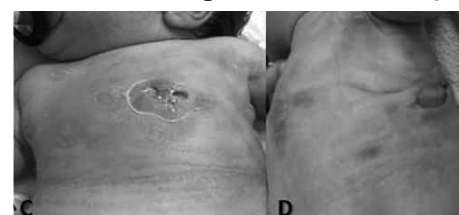
Figura 2. Evolução clínica da fasciite necrosante em região torácica da criança.

C: Áreas em processo de recuperação. D: Tecido de granulação, mostrando boa resposta à terapia antimicrobiana.