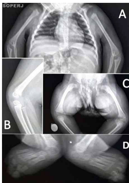
Figura 2 – Radiografias com malformações articulares. A) malformações em região cervical, ombros e cotovelos; B) foco em perfil de joelho direito; C) malformações em articulações do quadril; D) pé torto congênito bilateral

A artrogripose caracteriza-se como um sinal clínico que pode estar presente em mais de 300 doenças já descritas. Atualmente, adicionamos a esta lista a infecção congênita pelo vírus da Zika, tendo em vista a associação entre microcefalia e artrogripose em crianças nascidas de mães supostamente infectadas, mesmo que assintomáticas, durante a gestação. Segundo Linden, 5