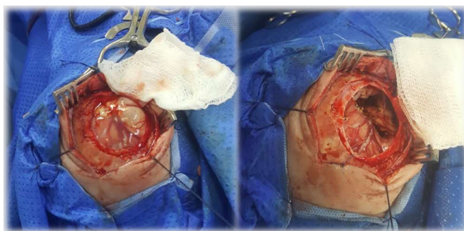
Figura 2. Craniotomia e drenagem de abscesso cerebral

completa de sepse com exames complementares, incluindo punção lombar, e início imediato de antibioticoterapia empírica. 8,9 Lactentes jovens (idade entre 1-3 meses de vida), faixa etária considerada de transição por não ter cobertura vacinal completa, podem apresentar tanto infecções por germes próprios de lactentes maiores quanto de recém-nascidos. 8,10